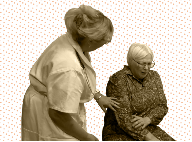
SchauspielerInnen von LendTeater